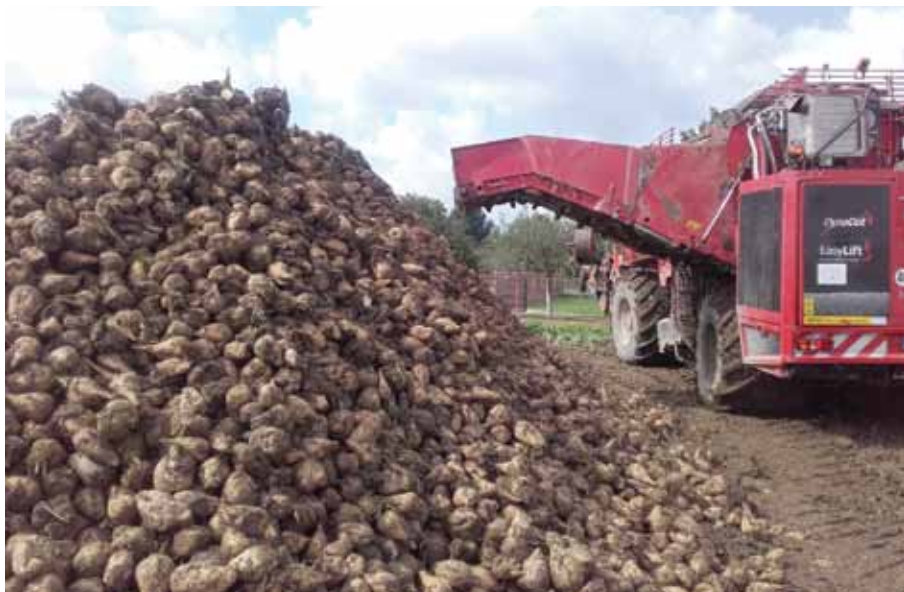
Formowanie przymy w gospodarstwie

(A.S.) Tak właściwe formowanie przymy jest niezbędne przy dłuższym przechowywaniu buraków i właściwym zabezpieczeniu ich przed niekorzystnymi warunkami pogodowymi. Dlatego już podczas zbioru sprawdzam czy aby do przymy nie dostają się znaczne zanieczyszczenia. Kontroluję czy buraki są dojrzałe technologicznie, a pod przymą nie ma kolein po wcześniejszych rozładunkach przyczep i czy przyma ma właściwe wymiary, aby w łatwy sposób okryć ją włókniną. Wiem, że w tym roku czeka mnie późniejszy termin odbioru i już zamówiłem włókninę w cukrowni w celu zabezpieczenia przymy.