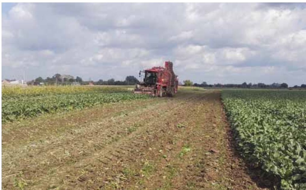
Zbiór buraków w gospodarstwie

ja takiego limitu nigdy nie posiadałem), ciężko mi było stać się plantatorem buraka cukrowego. Nie miałem żadnych możliwości zdobycia takiego limitu i może nawet przez brak możliwości nie próbowałem tego zmienić. Dopiero przy zniesieniu kwot cukrowych zainteresowałem się uprawą, porozmawiałem z sąsiadami uprawiającymi i tak trafiłem do cukrowni. (P.R.) I jakie są Pana wnioski, czy to była dobra decyzja?